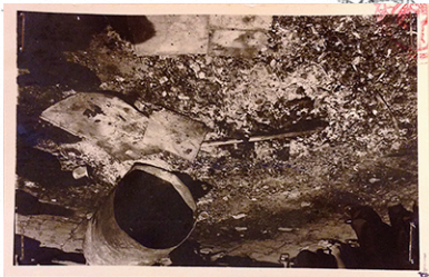
ภาพถ่ายสภาพของกระตูกซึ่งถูกเผาไหม้ทั้งหมด