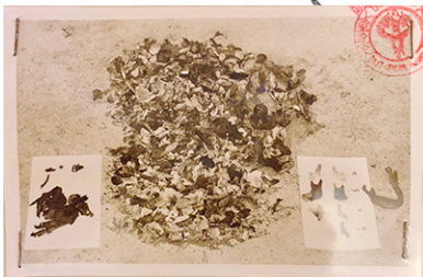
ภาพถ่ายสภาพกระตูกเผาไหม้ที่โกแบกออกมาจากเตาอบ และภาพถ่าย เปรียบเทียบกระตูกซากกรวยกลางส่วนหัวที่เนื้ซอกของศพ ทั้ง ๔ ศพ กับกรตูกขุดกรวยหัวอง