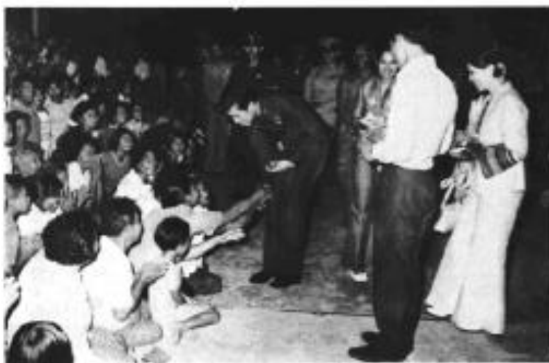
วันที่ ๖ ตุลาคม ๒๕๑๙ สมเด็จพระเจ้าลูกเธอเจ้าฟ้าสิรินธรเทพรัตนสุตา และ สมเด็จพระเจ้าลูกเธอเจ้าฟ้าจุฬาภรณวลัยลักษณ์ เสด็จไปเยี่ยมลูกเสือชาวบ้านที่จังหวัดใกล้เคียง 9 October 1976. Visiting with the people of Bang Sai Province.