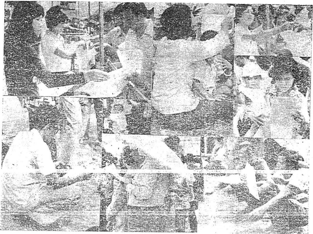
ประชาชนสนใจเอกสารสิ่งพิมพ์ที่ได้รับแจก

กันไป เพื่อให้เกิดความเข้าใจในเหตุการณ์ ๖ ต.ค. ที่ผ่านมาอย่างถูกต้อง เป็นที่น่าสังเกตอย่างหนึ่งสำหรับ กระจิมที่ ๑ น. คือทง ๆ ที่ประกาศไต่ ประกาศแล้วซ้ำอีกว่า กระจิมที่ ๑ น. ไม่มีอะไรให้ชม นอกจาก แจกจ่าย เอกสาร เมื่อหมดแล้วก็หมดไปจนกว่าจะได้เอกสาร มาแจกเพิ่มเติมอีก แต่ก็ยังมีคนมุ่ง กระจิมที่ ๑ น. กันอย่างแน่นหนาพอสมควร ลองเลียบ ๆ เคียง ๆ เข้าไปคุยบ้างจึงรู้ว่า “อ้อ! เขามุ่งดูประกาศนั่นเอง”