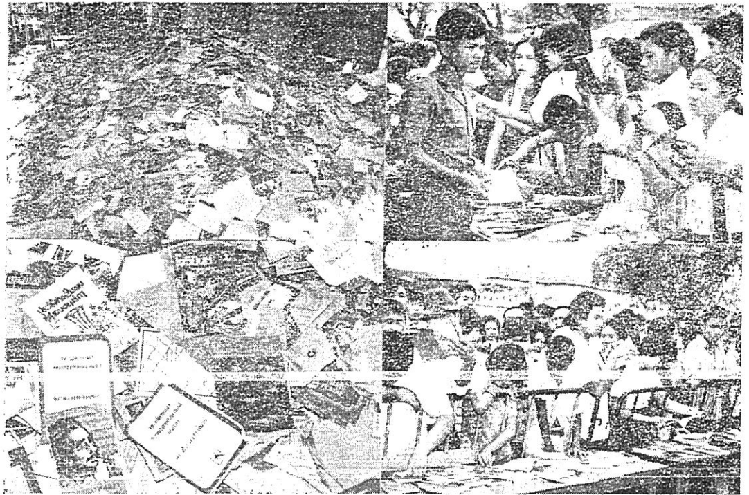
ประชาชนสนใจเอกสารที่ออกได้

จะไม่เคยเห็นมาก่อน บางคนอาจจะนึกไม่ถึงว่าเขาจะทำกันถึงเพียงนี้ และบางคนอาจจะนึกไม่ถึงว่าหนังสือที่เคยวางขายกันเกลื่อนตลาดทั้งในร้าน และตามแผงหนังสือในยุคนั้นนั้น จะเป็นหนังสือประเภทข้อแนะนำสถาบัน ชาติ ศาสนา และพระมหากษัตริย์