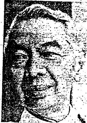
เสียดาย ปราโมช

"มีอย่างไทม พระอะไรที่ ผม ต้อง ไป สะกดไม่จริง แต่ไม่ใช่คนวงใน จะรู้ได้อย่างไร ไม่รู้ว่าเขาไปฟังใครพูด เามาจากไทม สะกด บ้านะช รัฐบาลที่เลือกตั้งมาจากประชาชน ก็ถูกกลุ่มไปทุกที่นั่นแหละ อดีตส่าห์เลือกตั้งกว่าจะได้ขึ้นมาเหมือนแทบตายตาแทบถน เรื่องอะไรจะไปทำอย่างนั้น ผมไม่อยากจะพูดว่าใครทำ เคยจะเป็น การ สง สย กลุ่ม ไทมกลุ่มนี้ เอาแต่ว่าผมไม่ได้สะกดก็แล้วกัน" หม่อม