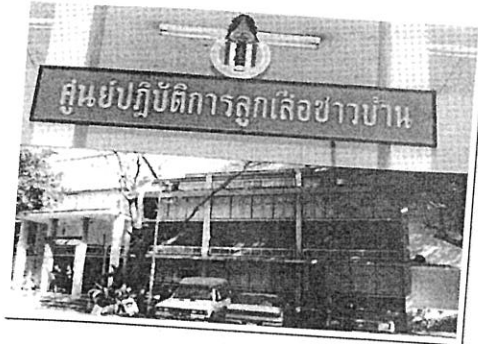
อาคารหลังเดิม