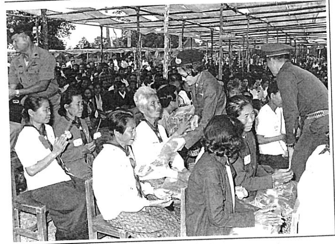
สมเด็จพระศรีนครินทร์บรมราชชนนี เสด็จพระราชดำเนินทอดพระเนตรการฝึกอบรมลูกเสือชาวบ้านเป็นครั้งแรก (รุ่นที่ ๙) ณ บ้านทรายมูล ต.น้ำก่ำ อ.ธาตุพนม จ.นครพนม เมื่อ ๒๙ พฤศจิกายน ๒๕๑๔