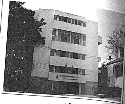
อาคารหลังใหม่