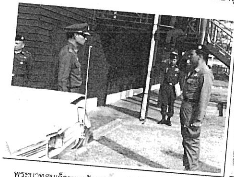
พระบาทสมเด็จพระเจ้าอยู่หัว เสด็จฯโดยรถยนต์พระที่นั่ง ถึงค่ายเสนีร์ณยุทธ พ.ต.อ.สมควร หริกุล กราบบังคมทูลรายงาน

วันที่ ๑๙ มีนาคม ๒๕๑๕ เวลาประมาณ ๑๔.๐๐ น. พระบาทสมเด็จพระเจ้าอยู่หัว พร้อมด้วย สมเด็จพระนางเจ้า พระบรมราชินีนาถ เสด็จพระราชดำเนินทอดพระเนตรกิจการลูกเสือชาวบ้าน ณ กองกักขังการ ตำรวจตระเวนชายแดนเขต ๔ ค่ายเสนีร์ณยุทธ จังหวัดอุดรธานี ทั้งสองพระองค์ได้ประทับ ณ อาคาร ห้องประชุมหลังเก่าที่ดัดแปลงมาจากอาคารจอรถยนต์ ด้านข้างอาคารที่ทำการ กองกักขังการหลังเดิม (ปัจจุบัน คือห้องประชุม ตรีศกวิบูลย์) โดย พันตำรวจเอก สมควร หริกุล ได้นั่งพับเพียบกับพื้น เพื่อกราบบังคมทูล ถึงการดำเนินการฝึกอบรม และการดำเนินกิจการของลูกเสือชาวบ้านถวายตลอดเวลา