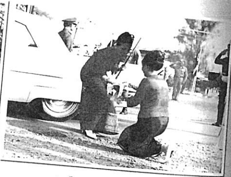
สมเด็จพระนางเจ้า พระบรมราชินีนาถ ทรงรับช็อคโกแลตจาก พ.ญ.สุภา หริกุล