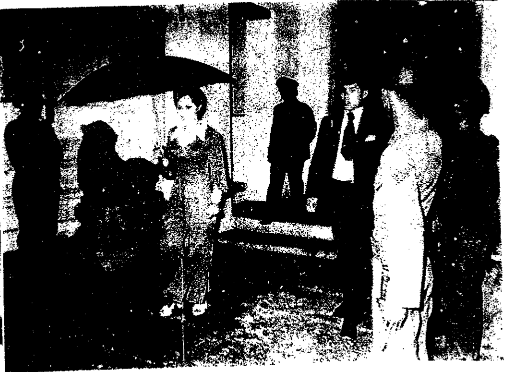
สมเด็จพระราชดำ ทรงมีพระราชดำรัส

แก้ไขไม่ได้ แต่ต้อง สถานการณ์ที่สำคัญ น้อยกันมากแล้ว กล้า ๆ ทรงเป็นห่วง ขอให้ทุกคนโชคดี”