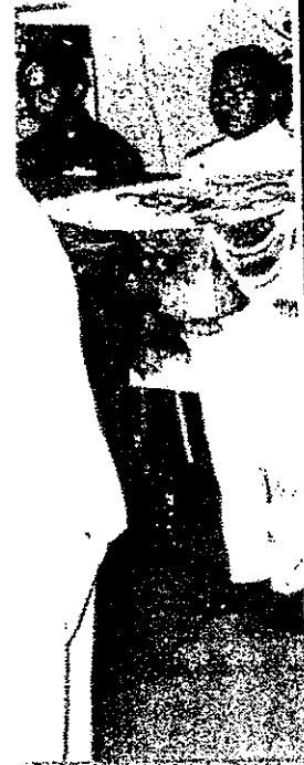
คันทพวงมาลาพระ

แก้ไขไม่ได้ แต่ต้อง สถานการณ์ที่สำคัญ น้อยกันมากแล้ว กล้า ๆ ทรงเป็นห่วง ขอให้ทุกคนโชคดี”