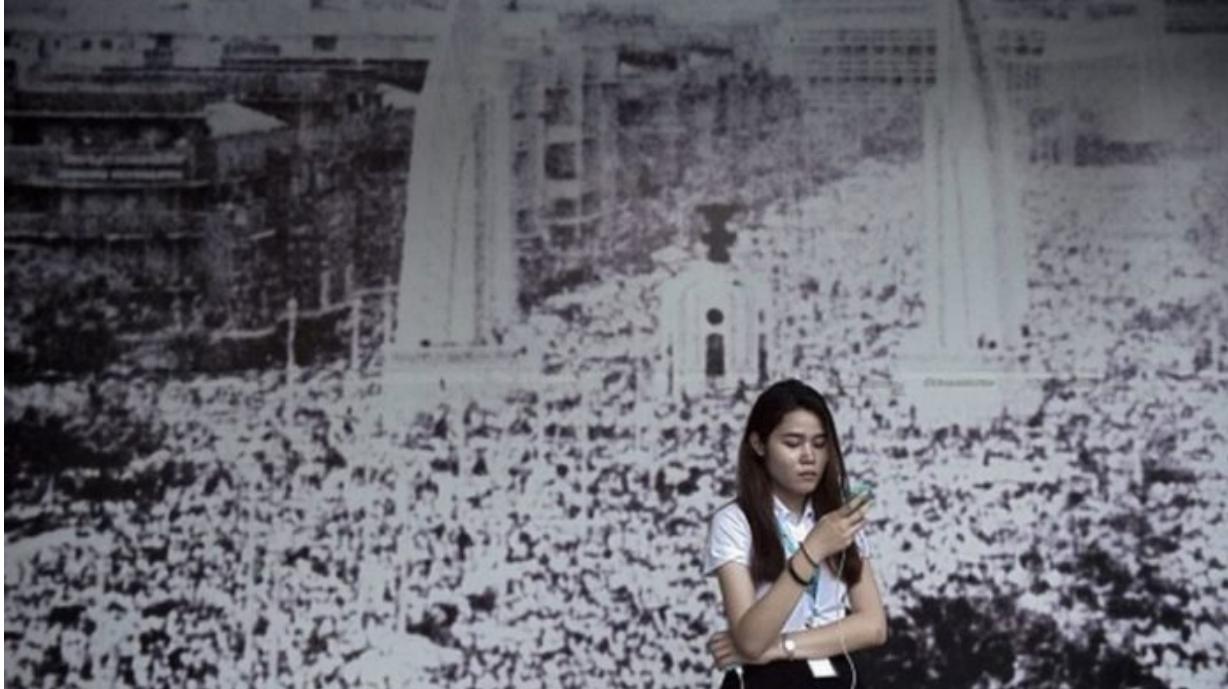
ภาพจำอนุสาวรีย์ประชาธิปไตยในฉากสำคัญทางประวัติศาสตร์ 14 ต.ค. 2516 เมื่อขบวนการนักศึกษาและประชาชนลุกฮือเรียกร้องรัฐธรรมนูญ