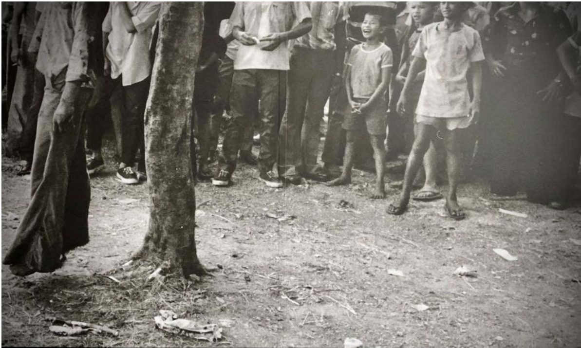
ภาพถ่ายโดยนีล อุลเลวิช (Neal Ulevich) ภาพนี้อยู่ในชุดภาพถ่าย "Photographs of disorder and brutality in the streets of Bangkok" ซึ่งได้รับรางวัลพูลิตเซอร์ในปี 1977 ปัจจุบัน ยังไม่มีข้อมูลใดๆ ของบุคคลทุกคนในภาพนี้

ที่สำคัญภายในงานยังมีการจัดแสดงภาพถ่ายรางวัล "พูลิตเซอร์" เมื่อปี ค.ศ.1977 ผลงานช่างภาพสำนักข่าวเอพี "นีล อุลเลวิช" (Neal Ulevich) ถูกนำมาขยายใหญ่จากภาพนักศึกษาที่ถูกฆ่าแขวนคอใต้ต้นมะขามบริเวณห้องสนามหลวง กำลังถูกเก้าอี้เหล็กทุบตี จนเป็นอีกหนึ่งภาพทางประวัติศาสตร์ที่ถูกบันทึกไว้ในเหตุการณ์ 6 ตุลา ขณะเดียวกันยังมีการจำลอง "โรงหนัง 6 ตุลา" เพื่อฉายภาพยนตร์สั้นจำนวน 4 เรื่อง ประกอบด้วย "เสียงแห่งความเจ็บ" "สองพี่น้อง" "พื้นที่ของความรุนแรง" และ "ด้วยความนับถือ"